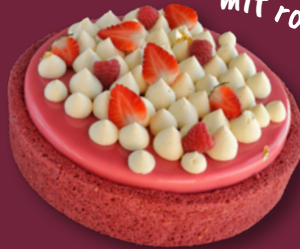
Erdbeere & Himbeere mit roter Spiegelglasur