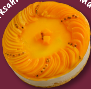
Quarksahne mit Pfirsich-Maracuja und Joghurt